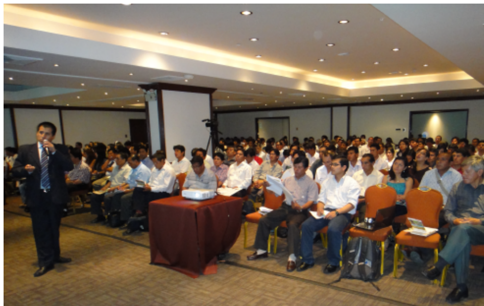
DGPP llevó a cabo ciclo de talleres de capacitación para funcionarios edilices

El objetivo principal de los talleres fue introducir a las autoridades municipales en los esquemas de incentivos municipales promovidos por el MEF, además de dar inicio a la implementación de asistencia técnica requerida por las municipalidades para que puedan cumplir con las metas exigidas por el PI para el 2012 y alcanzar sus objetivos institucionales.