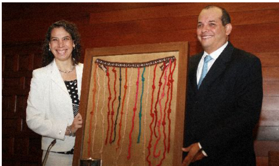
Ministro de Economía, Luis Miguel Castilla y titular del Midis, Carolina Trivelli lanzaron “Comisión Quipu”

“El MEF y el Midis están de la mano como socios estratégicos. Ello demuestra un cambio en las prioridades, un alineamiento importante en políticas públicas. Lo fundamental es trabajar en conjunto para lograr políticas públicas especialmente dirigidas a aquellos segmentos más pobres de la población, y que el objetivo de la inclusión social se materialice”, indicó Castilla Rubio. Explicó que la labor de la Comisión Quipu