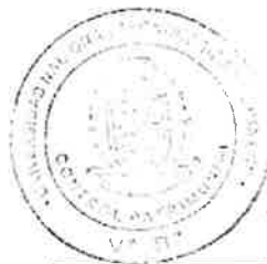
SMIT RUIZ QUISPE Encargado de Control Patrimonial UNTELS