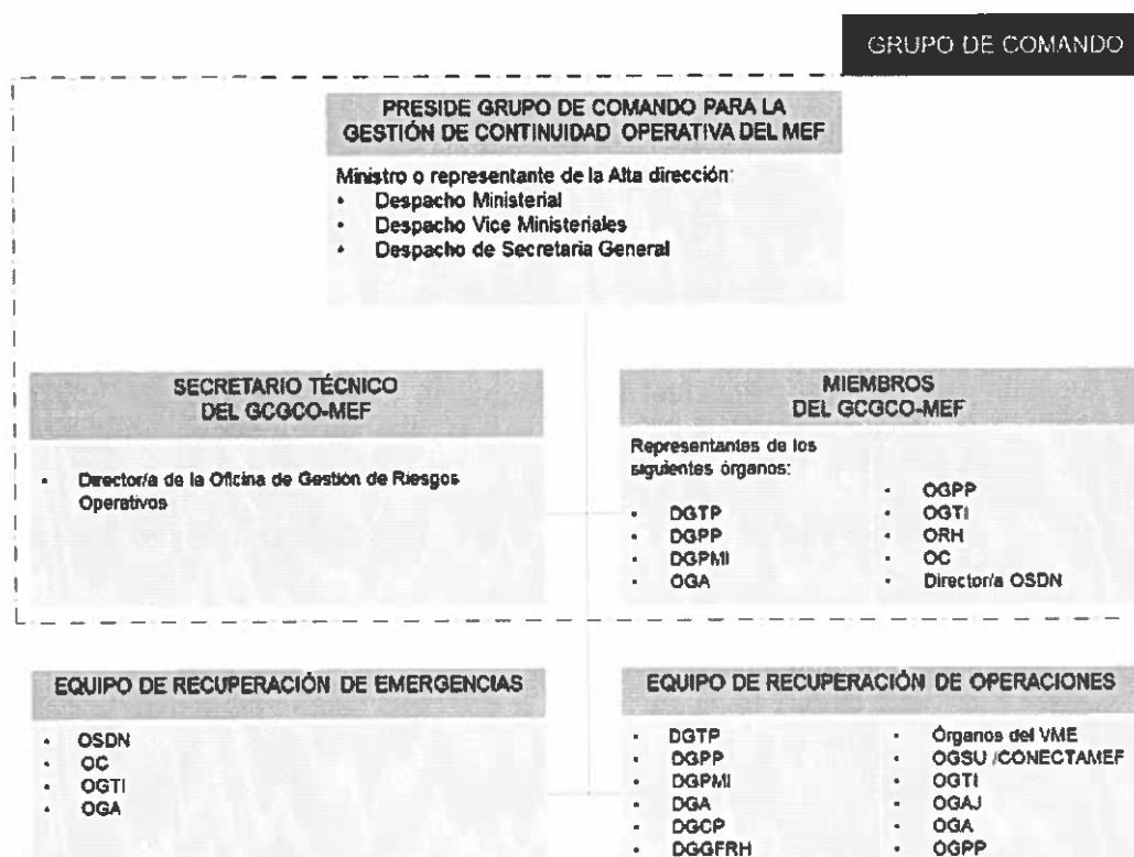
Gráfico N° 1 – Organización para la Gestión de la Continuidad Operativa

Se establece las siguientes premisas para la conformación de los equipos señalados en el gráfico: