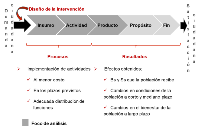
Figura 1: Cadena de valor de una intervención

Respecto a las segundas, se revisaron documentos de gestión del FSA y se hizo entrevistas a 16 funcionarios, del MINAGRI, Comité Técnico de FSA y Unidades Ejecutoras (Agrorural, PSI, FSA, etc.), y 49 actores locales (beneficiarios, contratistas, empresas, miembros de gobiernos locales, etc.) relacionados a 12 proyectos, en nueve distritos de las tres regiones seleccionadas para el estudio (Figura 2).