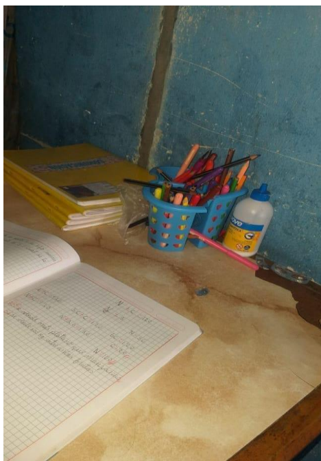
Imagen N° 4:

en Casa” 8 , y apoyarlo en la resolución de las tareas que le dejan en la escuela. Ella lo expresó a través del envío de la siguiente fotografía: