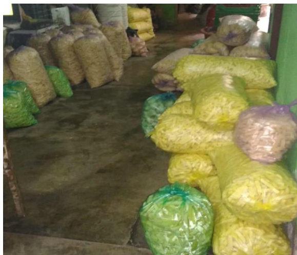
Imagen N° 3:

madres usuarias del estudio se han visto transformadas. Por ejemplo, Úrsula, antes de la cuarentena obligatoria, vendía pollo en una carretilla de uno de los mercados de VES, con un horario laboral que iba desde las 6:40 am hasta las 2:00 pm., aproximadamente. El salario oscilaba entre S/. 35 a S/ 40 soles diarios, dinero que empleaba para pagar sus cuentas personales y complementar el salario de su esposo, lo cual, según menciona, le brindaba estabilidad. Sin embargo, actualmente no está trabajando en el mercado por el temor a contraer la covid-19, pero sí apoya a su esposo en el negocio de pelar, cortar y distribuir papas, como se muestra en la siguiente imagen: