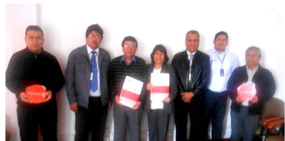
MUNICIPALIDAD PROVINCIAL DE BARRANCA