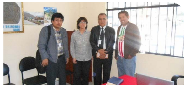
MUNICIPALIDAD DISTRITAL A. RAYMONDI