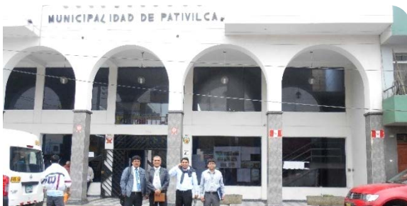
MUNICIPALIDAD DISTRITAL DE PATIVILCA