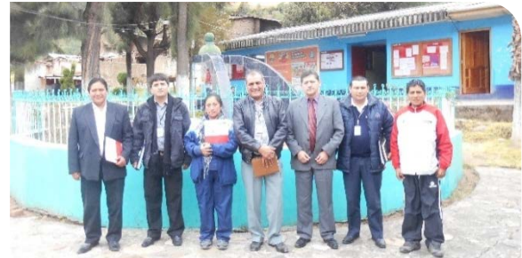
UNIDAD DE GESTION EDUCATIVA LOCAL DE SIHUAS