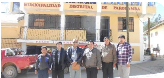
MUNICIPALIDAD DISTRITAL DE PAROBAMBA