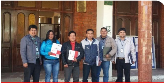
MUNICIPALIDAD PROVINCIAL DE OCROS