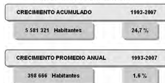
PERÚ: CRECIMIENTO POBLACIONAL, 1993 Y 2007