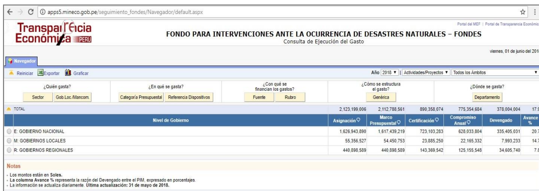
Figura N° 03

A continuación, el Sistema presenta la información de la ejecución del gasto por niveles de Gobierno: Gobierno Nacional, Gobiernos Locales y Gobiernos Regionales.