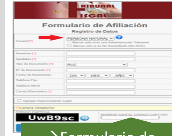
→ Formulario de Afiliación