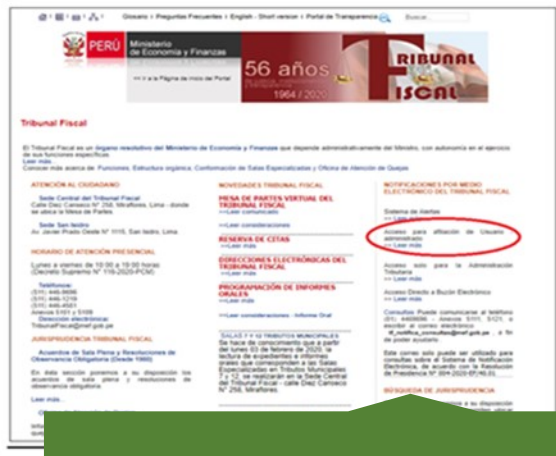
→ Página web TF