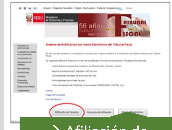
→ Afiliación de Usuario